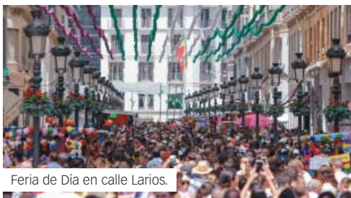
Feria de Día en calle Larios.

Verdiales. Panda Juvenil de Álora, estilo Almogía