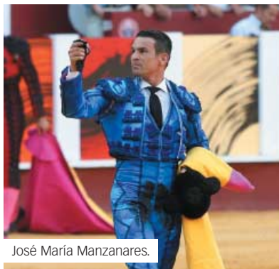
José María Manzanares.