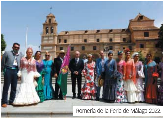
Romería de la Feria de Málaga 2022.

de una de las jornadas más emotivas de la Feria de Málaga, dando rienda suelta al baile, la diversión y la ilusión. Cientos de peregrinos recorrerán de nuevo, con entusiasmo, las calles de Málaga hasta la Basílica de la Virgen de la Victoria para realizar la tradicional ofrenda floral a la patrona con la intervención de la Banda Municipal de Música. La ruta que tendrá comienzo en las puertas del Ayuntamiento a las 11:00, después de la llegada de los peregrinos y jinetes, y de que se produzca