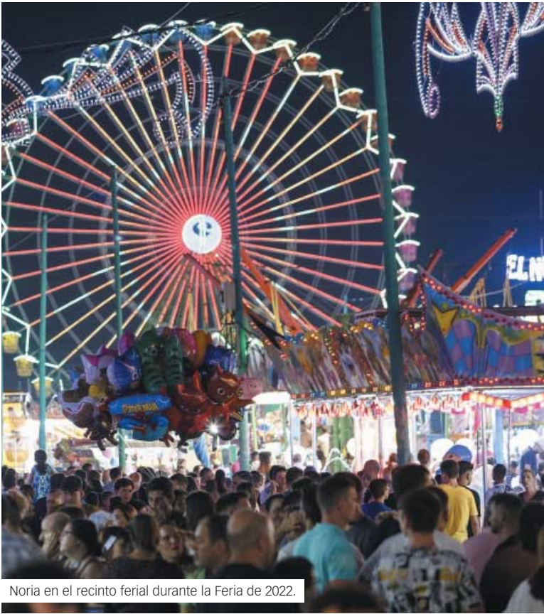
Noria en el recinto ferrial durante la Feria de 2022.

música a las 18:00, que es la hora de cierre de la Feria del Centro. Otra de las novedades es que por primera vez todas las casetas del Real se han adherido como Espacio Libre de Violencia Machista, ya que en años anteriores esta campaña solo llegaba a los espacios municipales. También, se darán talleres formativos a todos los empleados y voluntarios de dichos locales en materia de actuación ante cualquier agre-