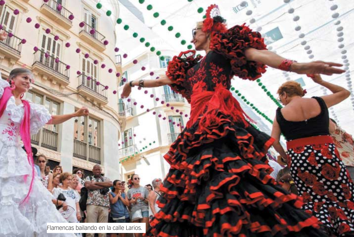
Flamencas bailando en la calle Larios.