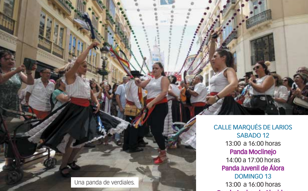
Una panda de verdiales.