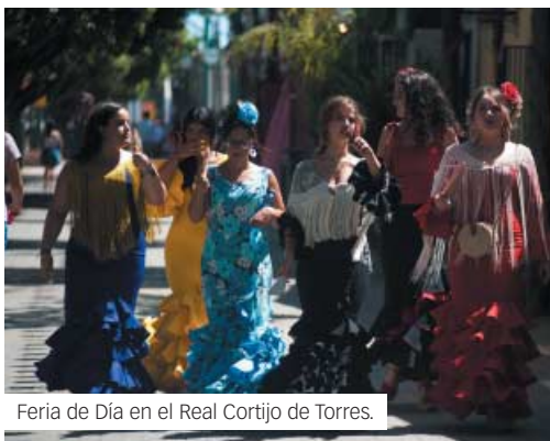
Feria de Día en el Real Cortijo de Torres.