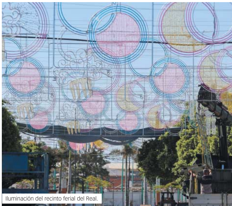
Iluminación del recinto ferial del Real.