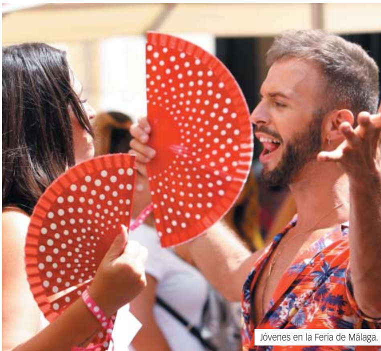
Jóvenes en la Feria de Málaga.