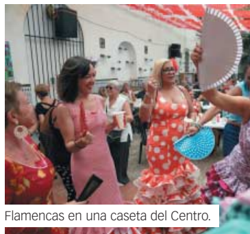
Flamencas en una caseta del Centro.