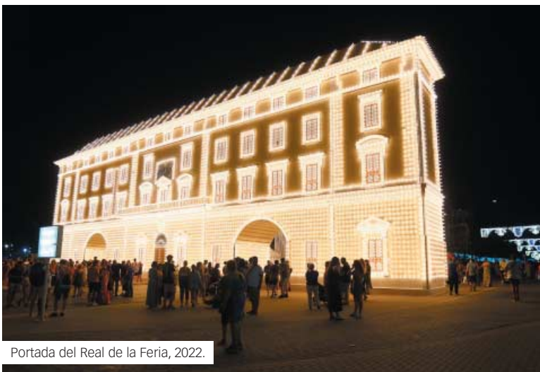
Portada del Real de la Feria, 2022.