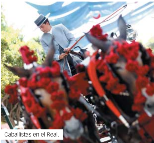
Caballistas en el Real.