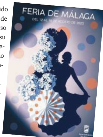
Cartel de la Feria de Málaga 2023.