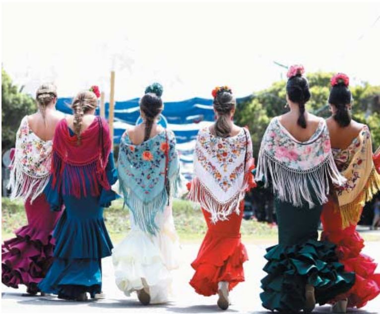
Mujeres paseando por el Real, 2022.