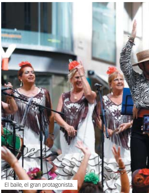
El baile, el gran protagonista.