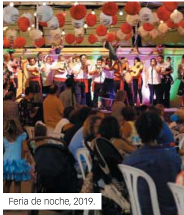
Feria de noche, 2019.