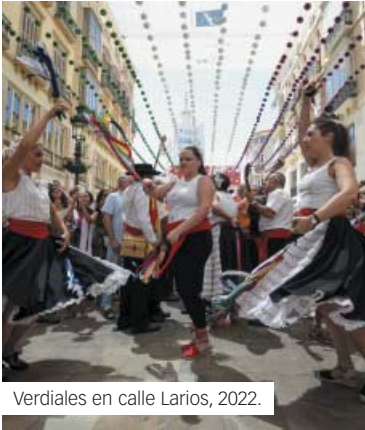
Verdiales en calle Larios, 2022.