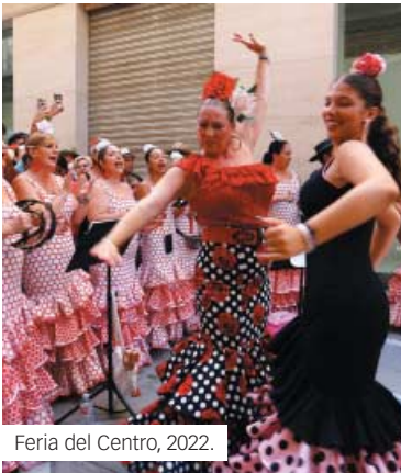
Feria del Centro, 2022.