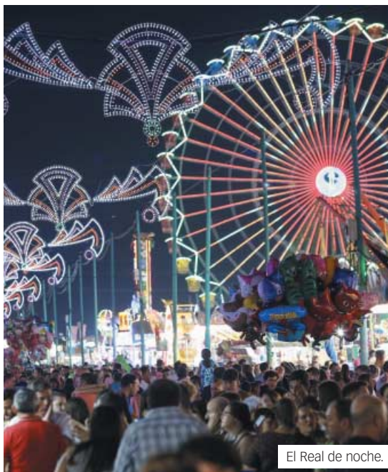
El Real de noche.

Eusebio Valderrama, calle de las Bulerías o calle de la Jabera son algunas de ellas. La iluminación corre a cargo de los farolillos y de las grandes portadas, que cada año se convierten en el punto de encuentro preferido de los feriantes. Estos abren sus puertas a todos aquellos que quieran elegir pasar la noche con ellos. Durante semanas han estado preparándose para que la bienvenida sea lo más cálida posible. La música y el baile están asegurados. Una gran oferta de actividades tanto para el día y especialmente para la noche, que invitan a no