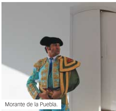
Morante de la Puebla.