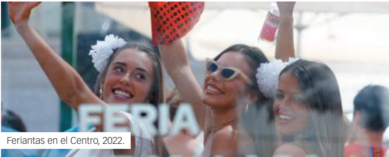
Feriantas en el Centro, 2022.