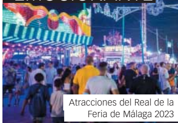
Atracciones del Real de la Feria de Málaga 2023

➤ Luz y color acompañados de música. Los más pequeños corren por el Real ansiosos por subir a esos carruseles coloridos. Vueltas y vueltas en la noria, tómbolas con pre-