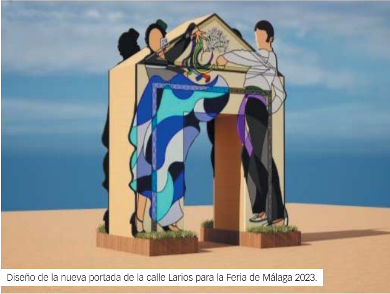
Diseño de la nueva portada de la calle Larios para la Feria de Málaga 2023.