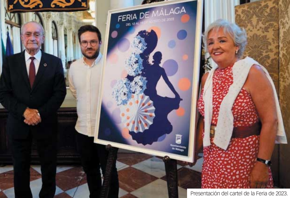
Presentación del cartel de la Feria de 2023.