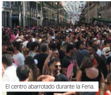
El centro abarrotado durante la Feria.